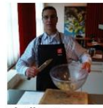
Ab Elhour Manager FM